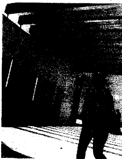
La sede dell'Arca del Tempo, a Settimo San Pietro