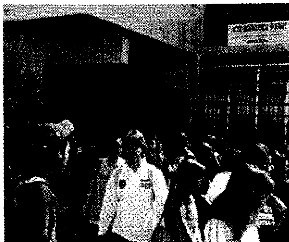
A Pitz'e Serra nascerà un campus liceale