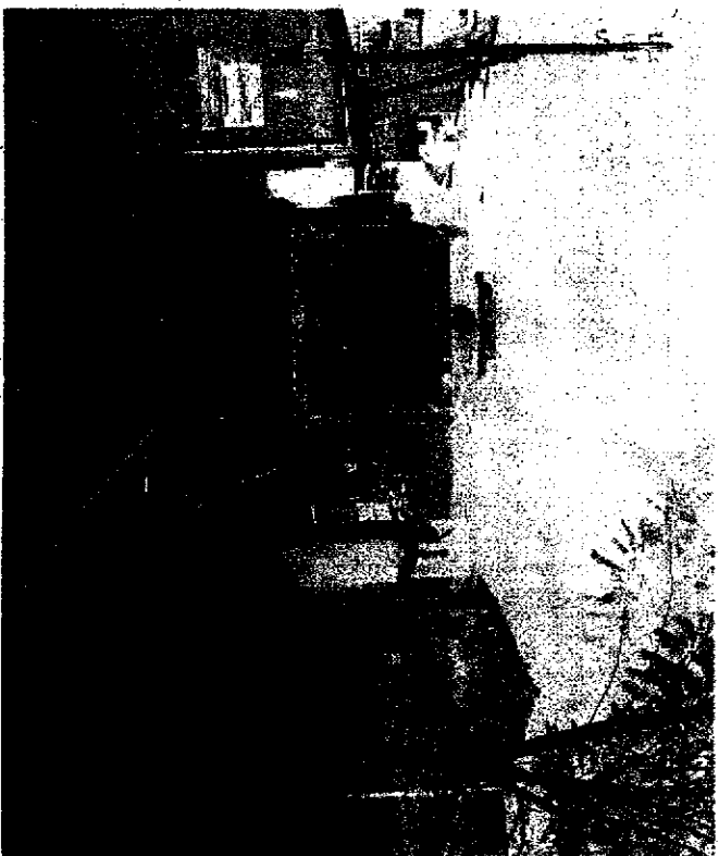
Il tracciato delle Fds sarà utilizzato per la metropolitana leggera