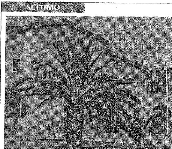
Il Palazzo municipale a Settimo